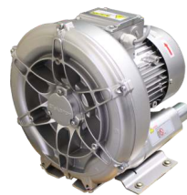
Kühlgebläse TB 0310