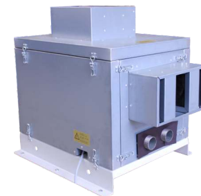
Schallschutzkammer TB 0310-AE (optional)