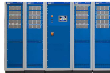
Verstärker (Abb. ähnlich)