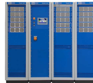
Verstärker (Abb. ähnlich)